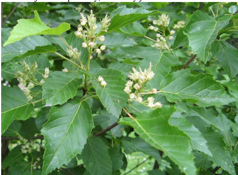
Listy – vstřícné

Květy – ve vzpřímených latách, pětičetné, funkčně jednopohlavné (samčí se zakrnělým pestíkem, samičí s neotvírajícími se prašníky) – rostliny jednodomé